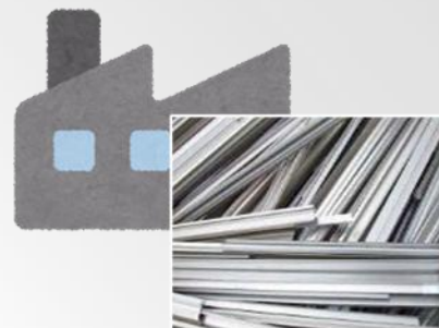
金属問屋・古物商