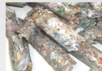
再生利用 (RPF燃料) (ボイラー助熱材等)