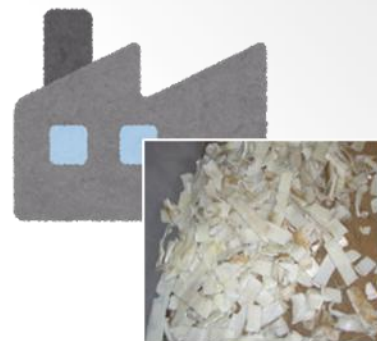
処理業者・加工業者